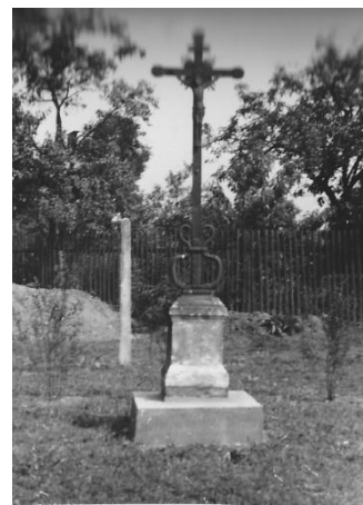
červen 1966 po přemístění