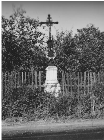
15.10.1961 před přemístěním

Domnívám se, že v prvním případě mohlo se jednat o kříž, který stával při státní silnici v bývalé zahradě u