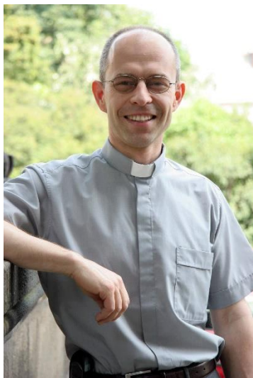
Mše na Malé Sv. Hoře, 1. 5. 2021