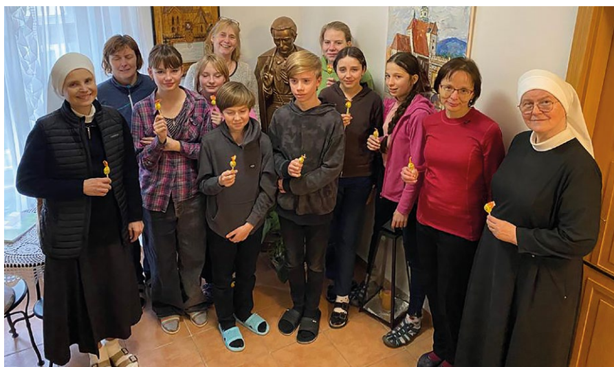
Skupinka těch, kdo se připravují na biřmování, na víkendovce u sester Boromejek v Prachaticích

Na poslání biřmovaného bychom neměli hledět jako na jeho soukromou zálibu. Je to především povolání Boží a také důsledek plynoucí z milosti, jež se při biřmování uděluje. Je to start služby v církvi, jímž to podstatné začíná (nikoliv končí).