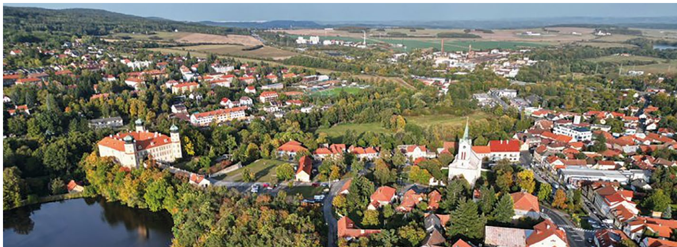
Mníšek se svými lesy – foto Petr Dušek