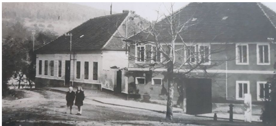
Bývalá škola, dnešní pošta