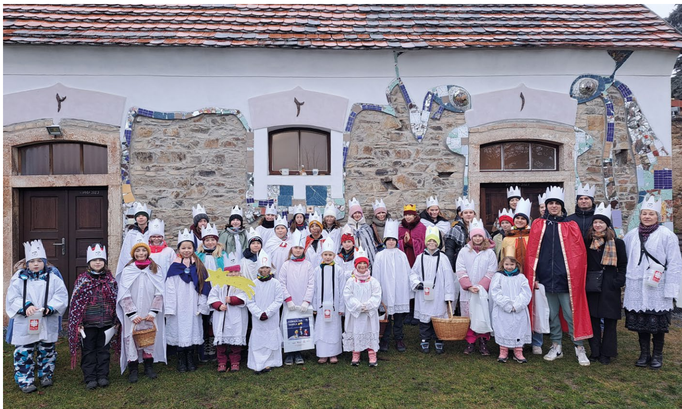
O letošní Tříkrálové sbírce se vybralo celkem 145 652 Kč. Všem dárcům i koledníkům děkujeme!