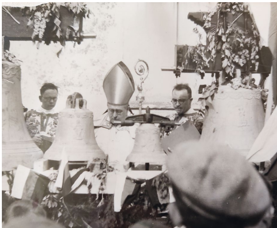
Upomínka na svěcení zvonů z Mníšku v roce 1934