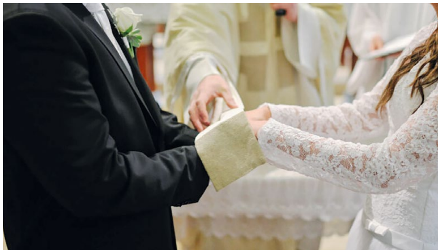
Ilustrační foto převzato z internetu

Přátelská láska se nazývá „caritas“, když vnímá „vznešenou hodnotu“ druhého a váží si jí. Krása – „vznešená hodnota“ druhého, která není totožná s jeho fyzickou nebo psychickou atraktivitou – nám dovoluje vychutnávat posvátnost druhé osoby bez pudové nutnosti ji vlastnit. V konzumní společnosti se oslabuje estetické cítění, a tím mizí radost. Něha je projev té lásky, která se osvobozuje od sobecké touhy po sobeckém vlastnění. Přivádí nás k tomu, že před člověkem takřka pocítujeme chvění z nesmírné úcty a určitého strachu, abychom mu neuškodili nebo ho nepřipravili o jeho svobodu.