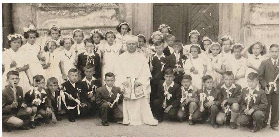
První svaté přijímání v Chotěšově

Pak mám ještě jednu vzpomínku. Když umřel mníšecký farář, tak byl v Mníšku pohřeb, na který přijel kromě asi osmi